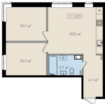
Схема жилого помещения (квартиры)